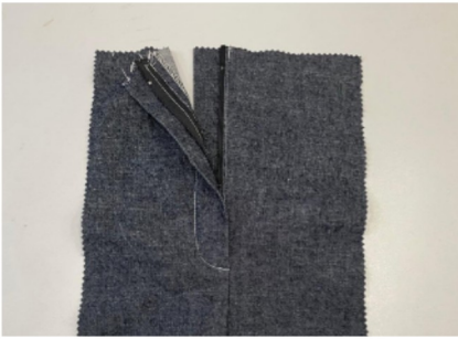
1. Gulp sluiting pantalon