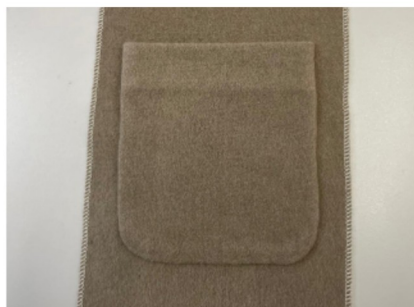
8. Blind opgezette zak