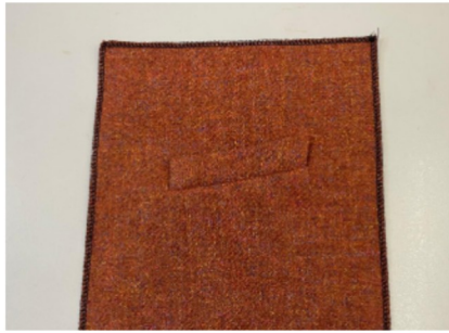
2. Borstzakje voor colbert