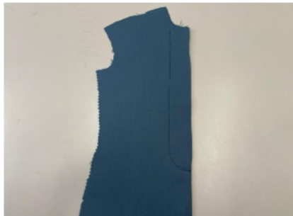
6. Blinde sluiting voor een mantel