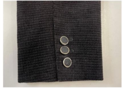
3. Tweedelige mouw met split met onderslag en Engelse hoek met voering eraan