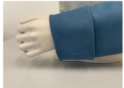
7. Mouwafwerking met manchet op vorm (mouwkap)