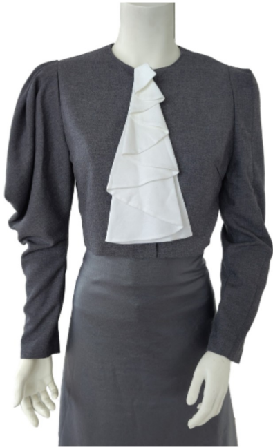
4. Romeinse/gedrapeerde mouw 5. Mouw met deelnaad evenwijdig aan de kop 10. Jabot